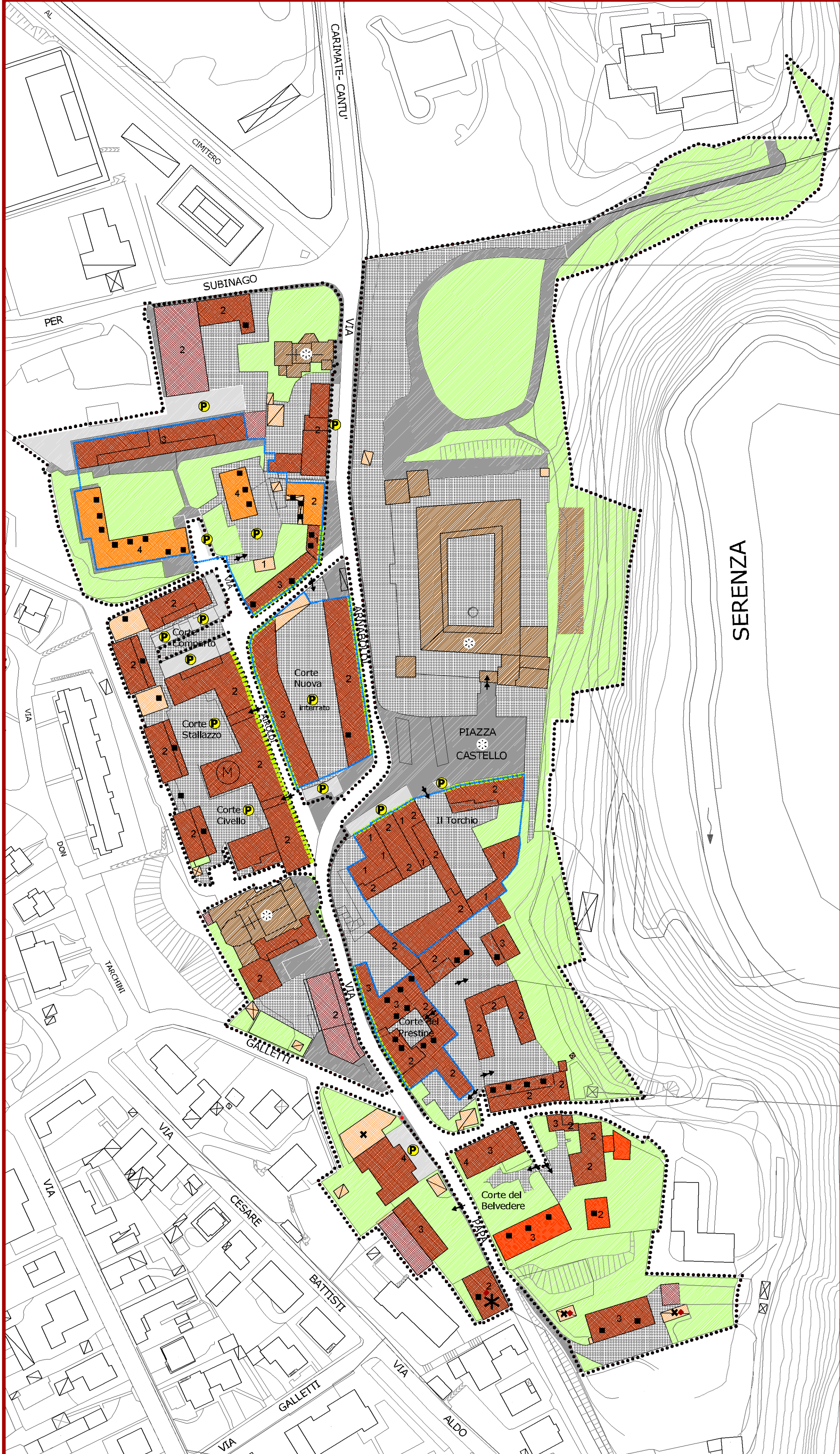
NUCLEO DI CARIMATE