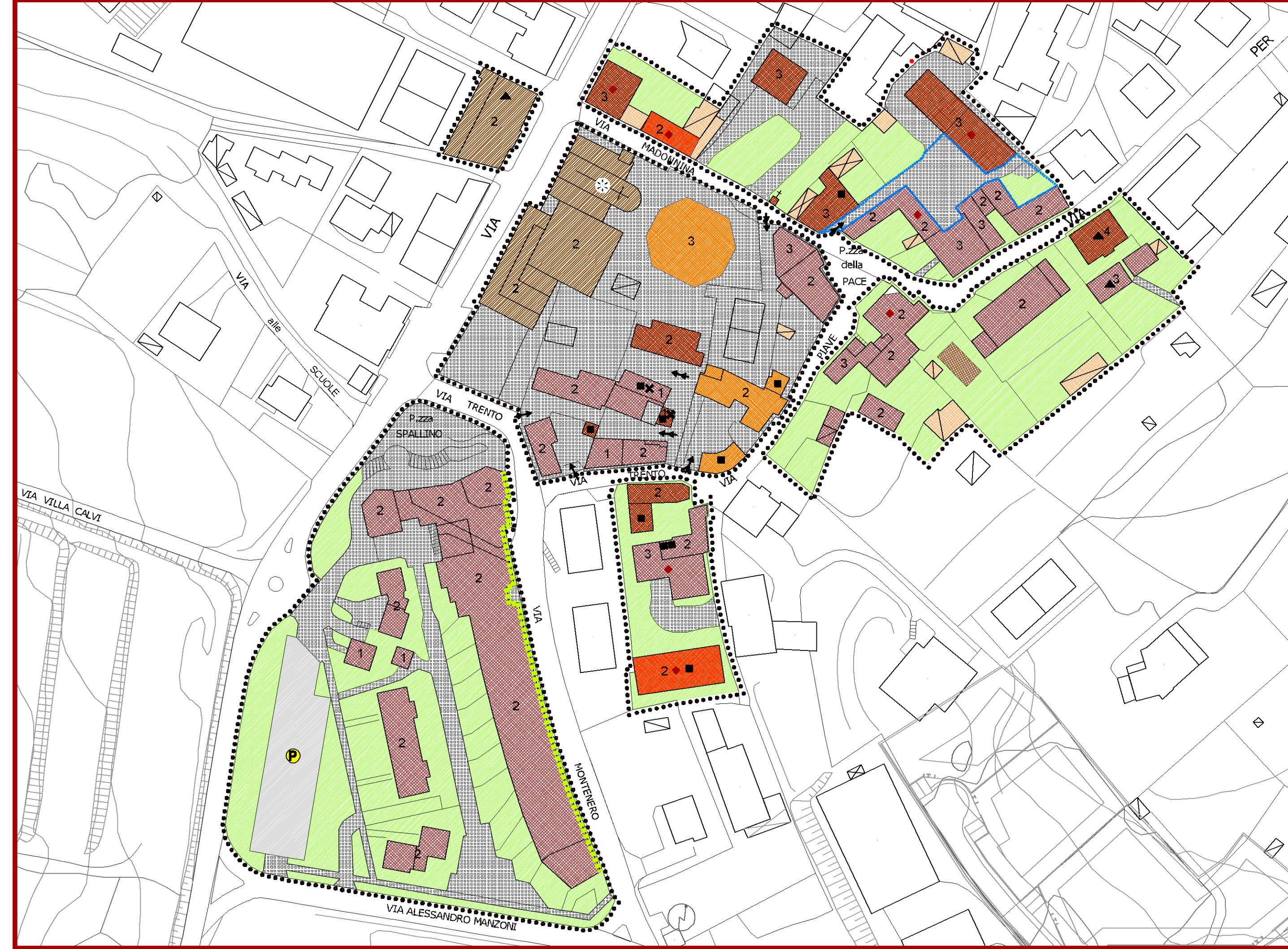
NUCLEO DI MONTESOLARO