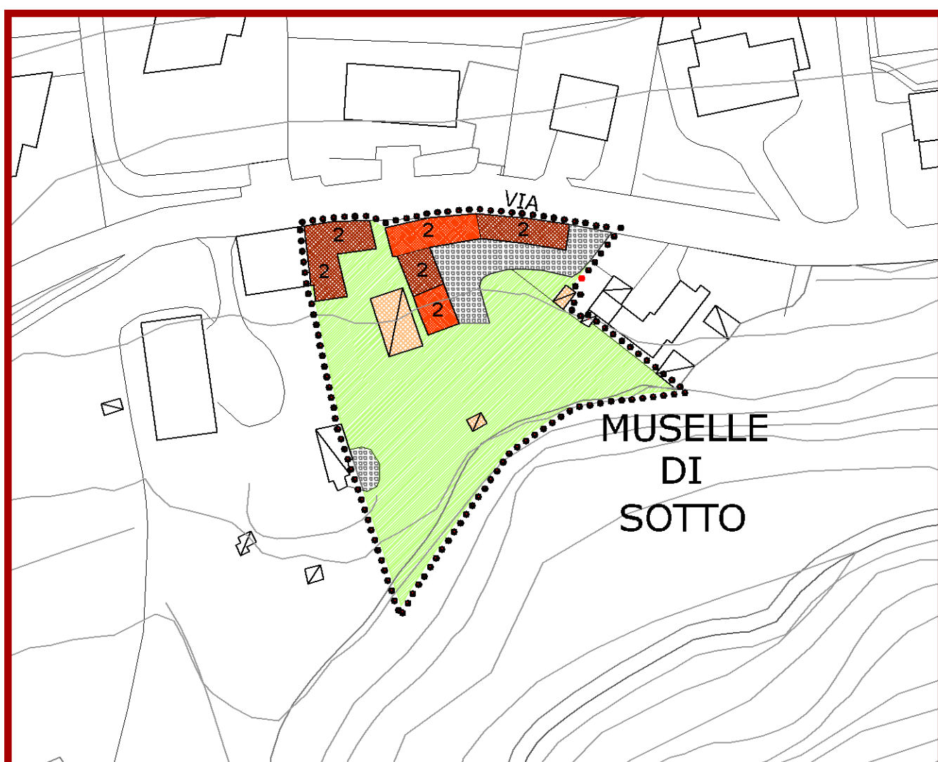
CASCINA MUSELLE INFERIORE