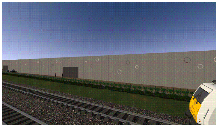
RENDERING N° 3 PROSPETTO A (VEDI TAVOLA N° 16 ALLEGATA)