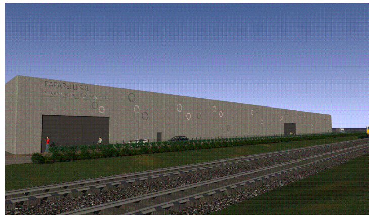
RENDERING N° 2 PROSPETTO A (VEDI TAVOLA N° 16 ALLEGATA)