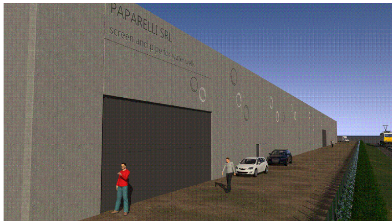
RENDERING N° 1 PROSPETTO A (VEDI TAVOLA N° 16 ALLEGATA)