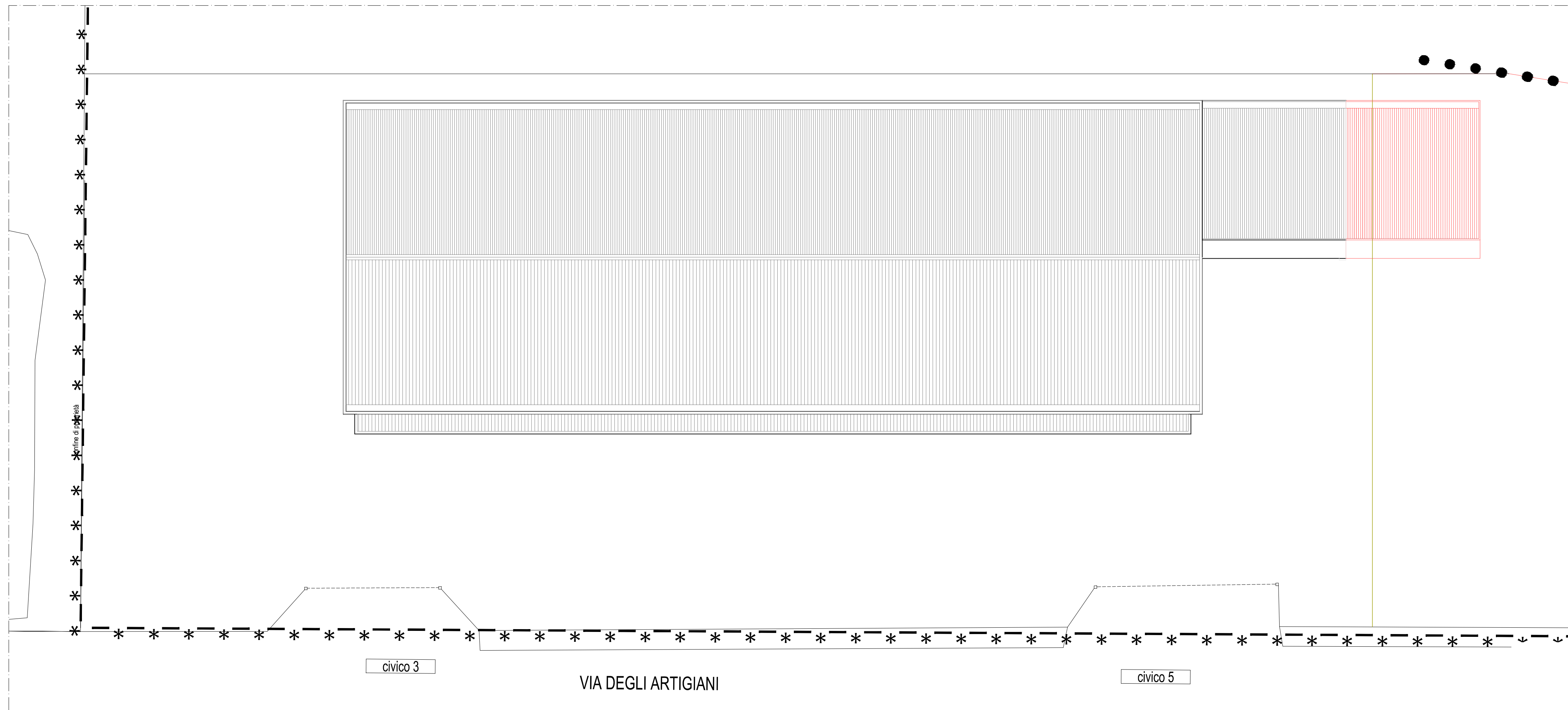
ZONA LAVAGGIO MEZZI: pianta piano TERRA SC. 1:200