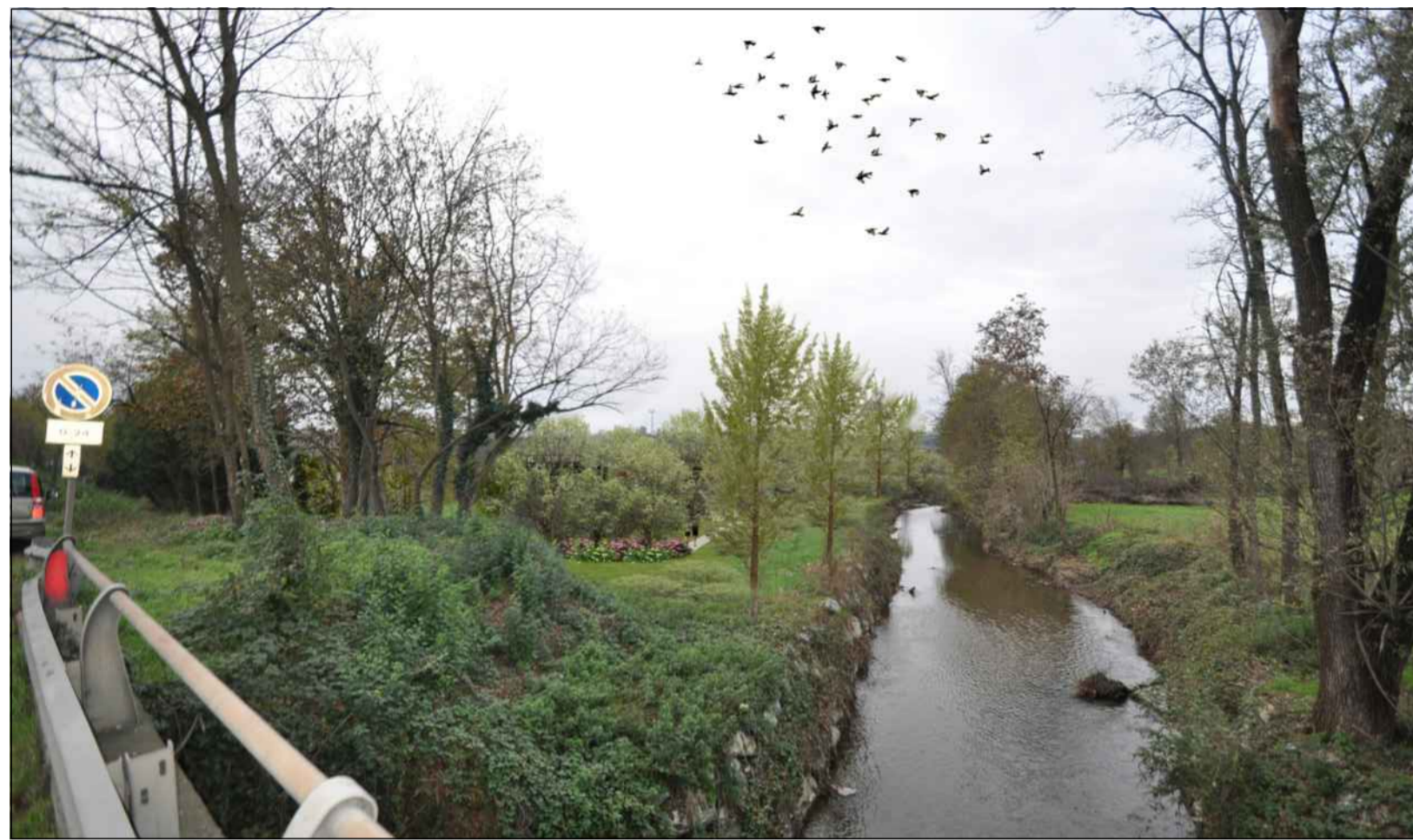
SIMULAZIONE FOTOGRAFICA DALLA S.P. NOVEDRATESE IN PROSSIMITA' DEL TORRENTE SEVESO