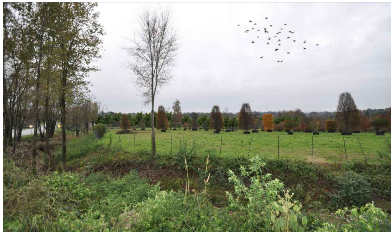
SIMULAZIONE FOTOGRAFICA IN PROSSIMITA' DELL'IMBOCCO SULLA S.P. NOVEDRATESE