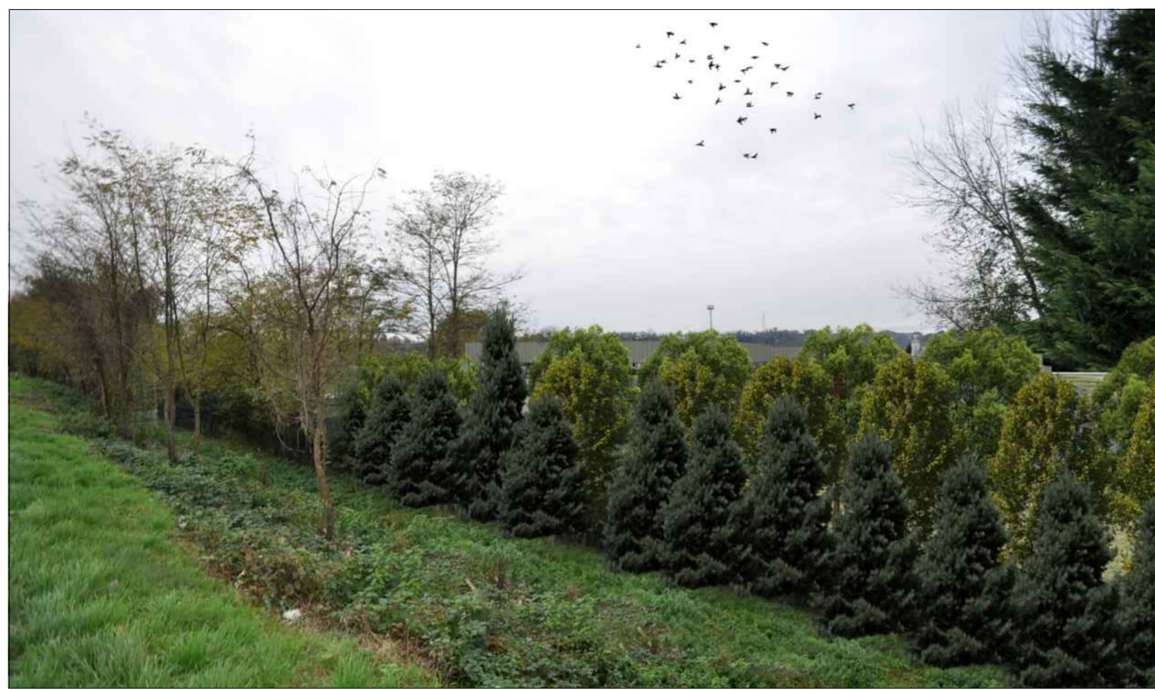
SIMULAZIONE FOTOGRAFICA DALLA S.P. NOVEDRATESE