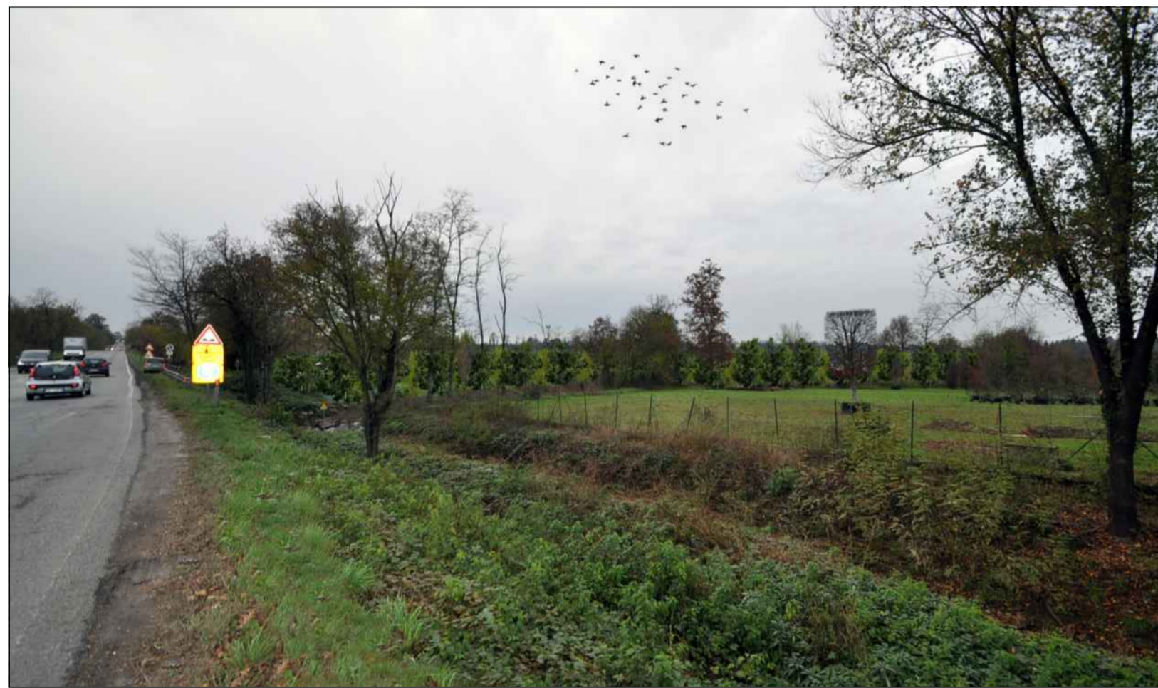
SIMULAZIONE FOTOGRAFICA IN PROSSIMITA' DELL'IMBOCCO SULLA S.P. NOVEDRATESE