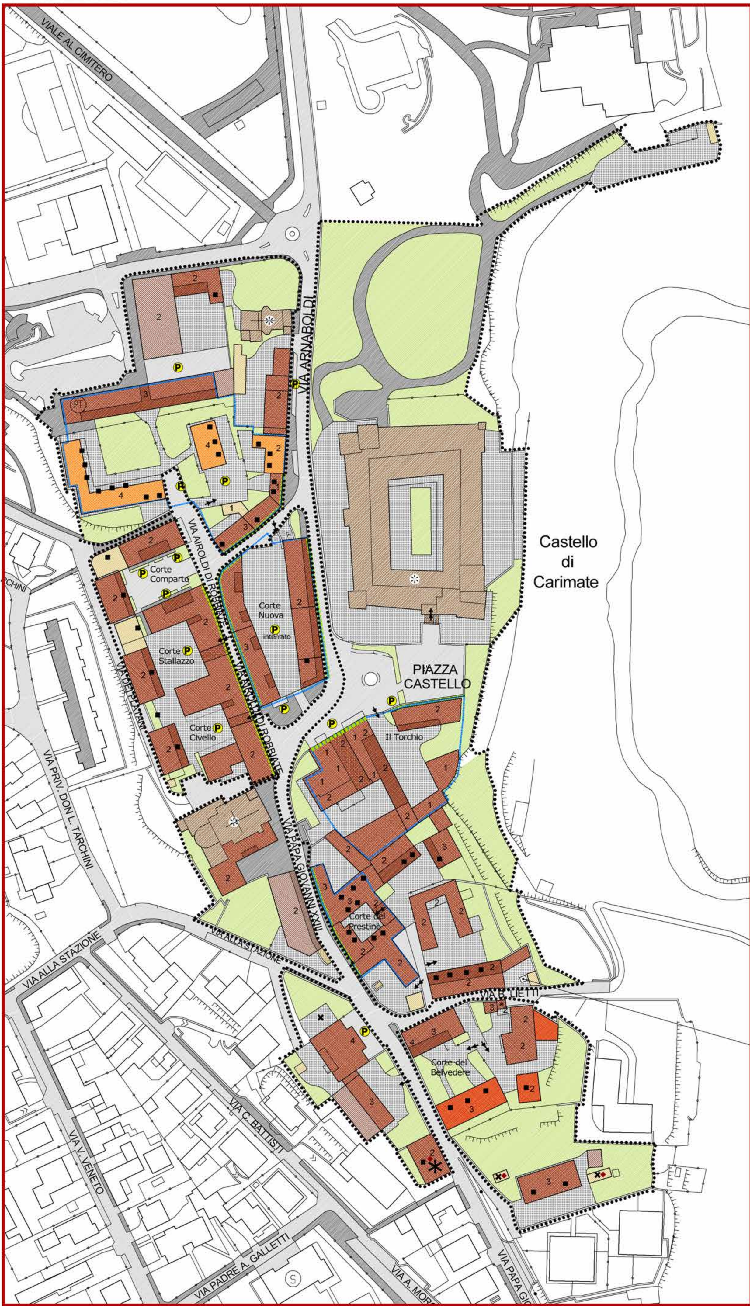
NUCLEO DI CARIMATE