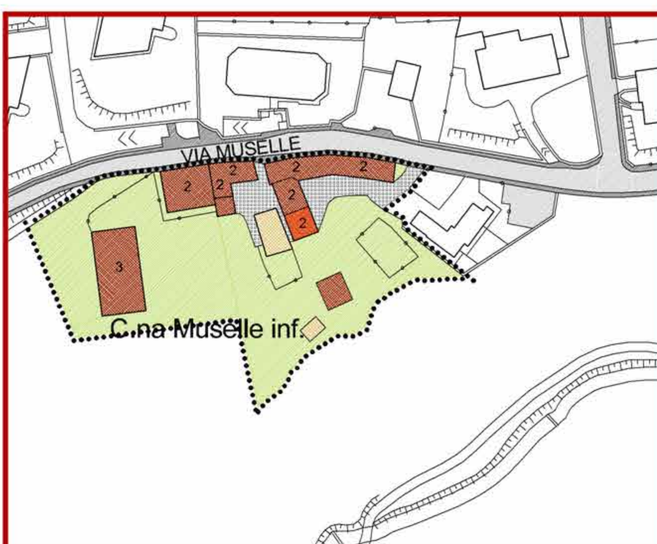
CASCINA MUSELLE INFERIORE