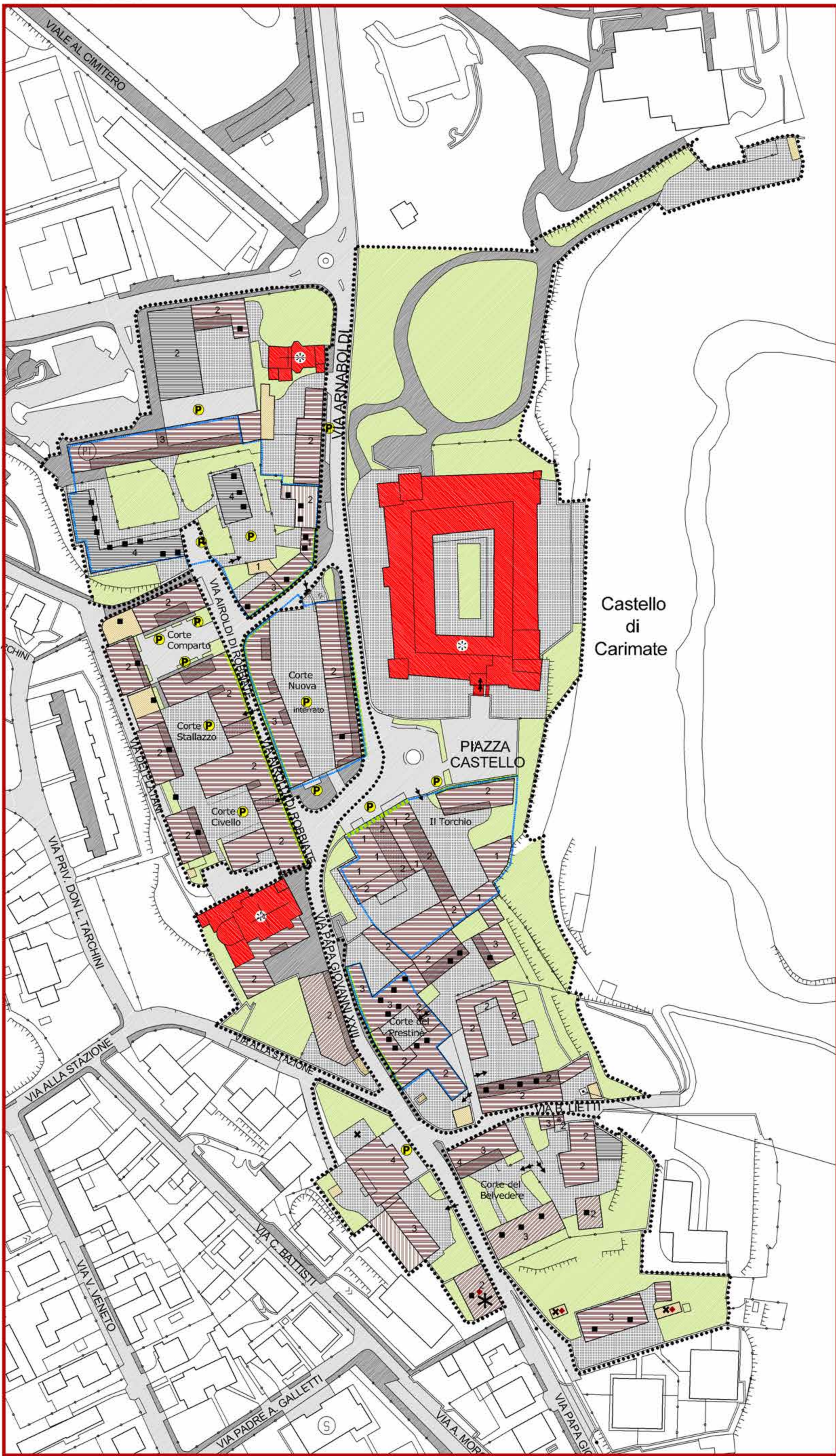
NUCLEO DI CARIMATE