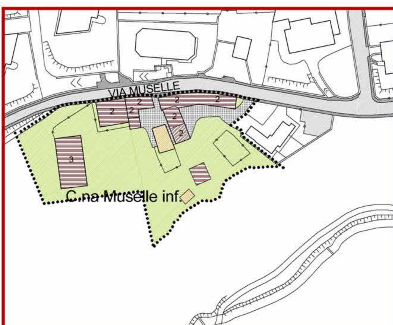
CASCINA MUSELLE INFERIORE