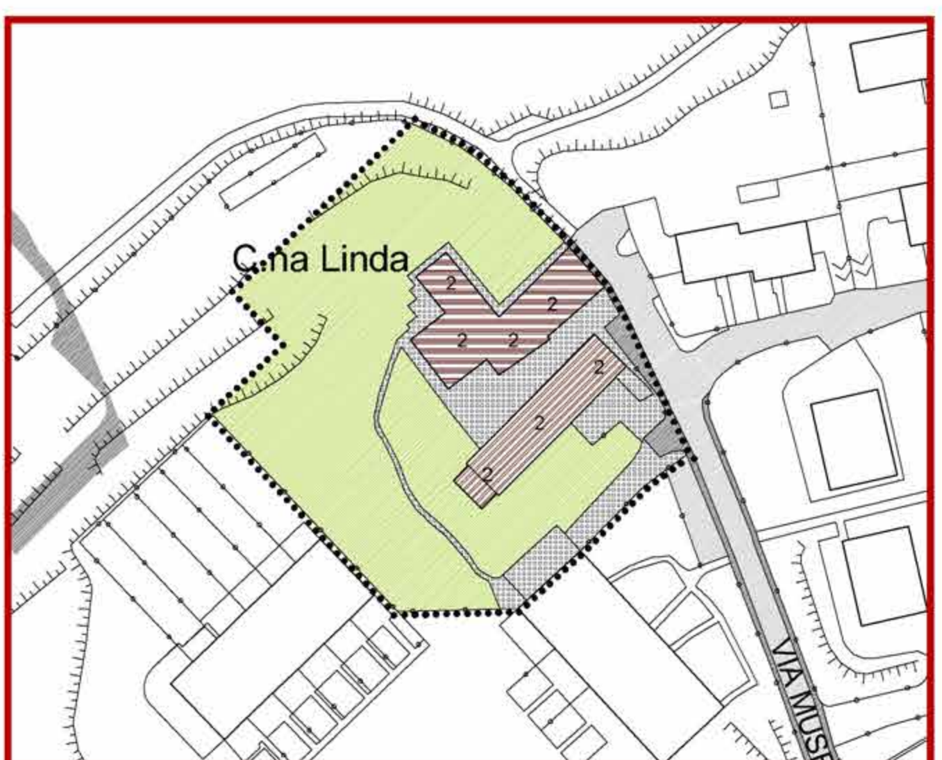
CASCINA MUSELLE SUPERIORE